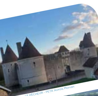
© Charlotte LE PÉCHEUR - PETR Auxois Morvan

En collaboration avec l'ensemble des acteurs soucieux du bien-être des habitants du territoire, des actions au plus près des besoins locaux sont menées autour de 3 axes Santé principaux : la démographie médicale , la prévention et la santé mentale.