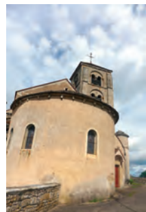
Mont-Saint-Jean © PAH Auxois Morvan